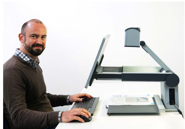
Visio 500: Lesen und Schreiben in Full HD Auflösung