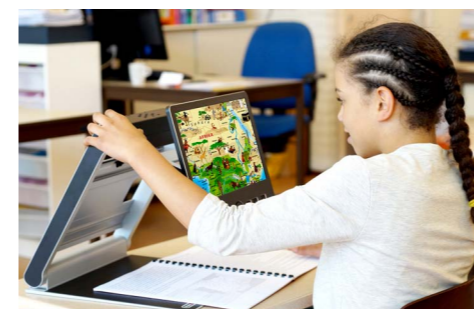
VisioBook HD ist klein, leicht und handlich und ideal für einen mobilen Nutzer.

VisioDesk ist trotz 15,6" Bildschirm kompakt und mit seinem Gewicht von ca. 4,8 kg gut zu tragen. Zudem kann es 5 Stunden netzunabhängig betrieben und in der mitgelieferten Tragetasche verstaut werden. VisioDesk ist somit für denjenigen Nutzer zu empfehlen, der Wert auf eine größere Bildschirmübersicht sowie -vergrößerung legt und im Gegensatz zu fixen Bildschirmlesegeräten die Möglichkeit haben möchte, den Arbeitsort gelegentlich ohne großen Aufwand zu wechseln.