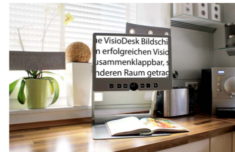
VisioDesk erlaubt den flexiblen Einsatz an unterschiedlichen Orten.